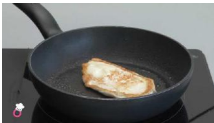
Freímos un filete de pollo con poco aceite.

Echamos a una olla rápida las judías verdes, la patata y agua hasta cubrir las verduras. Cocinamos según el tipo de olla. Olla Rápida: a fuego alto hasta que suba la válvula y después a fuego medio durante 10 minutos. Dejamos que baje antes de abrir. Olla Normal: a fuego medio durante 30 minutos.