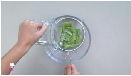
Lavamos las judías verdes.