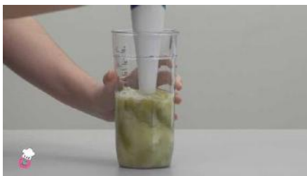
Batimos hasta que el puré tenga la textura deseada.

Para los menos "baby" de la casa, servimos por un lado el filete y por otro las verduras.